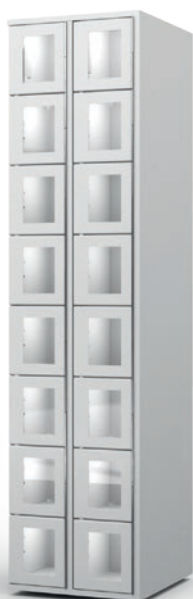
Colonne vitrée 8 casiers doubles CL16DW